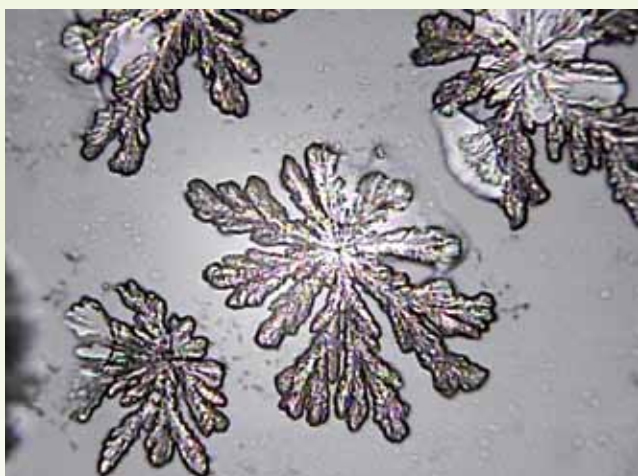
Remus Quelle: 400-fach vergrößert